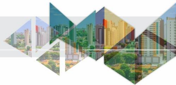
Figura 1 - Mercado de trabalho piauiense - PNAD Contínua